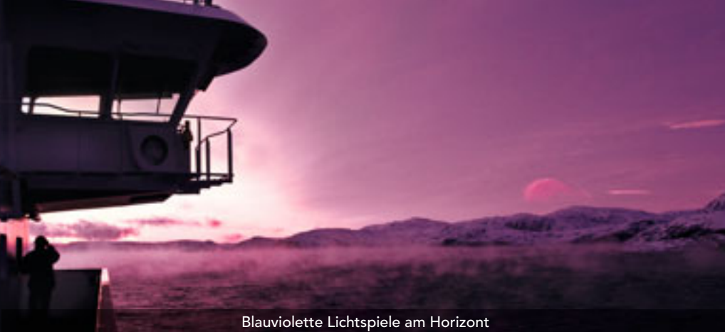
Blauviolette Lichtspiele am Horizont