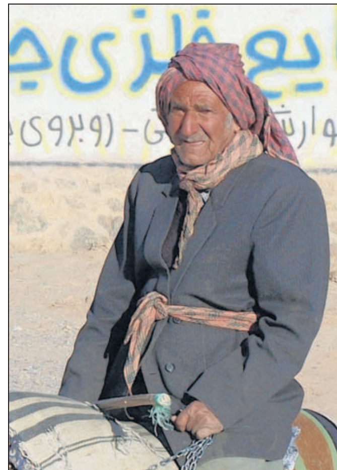
Dieser Wächter des Friedhofes der Zoroastrier in Yasd war mit seinem Esel unterwegs.