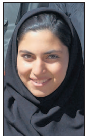
Eine junge Iranerin in Pasargadae bei Schiras.

Von der Bevölkerung des Landes mit über 80 Mio Menschen ist ein hoher Anteil unter 40 Jahre alt. 1979 erreichte die Revolution mit der Vertreibung Schah Reza Pahlevis und der Rückkehr des Ayatollah Khomeini ihren Höhepunkt. Eine streng religiöse Staatsform, Theokratie genannt, wurde errichtet. Schade nur, so lerne ich, dass die neuen Machthaber ihre Versprechungen alsbald nicht einhielten, die sie vorher abge-