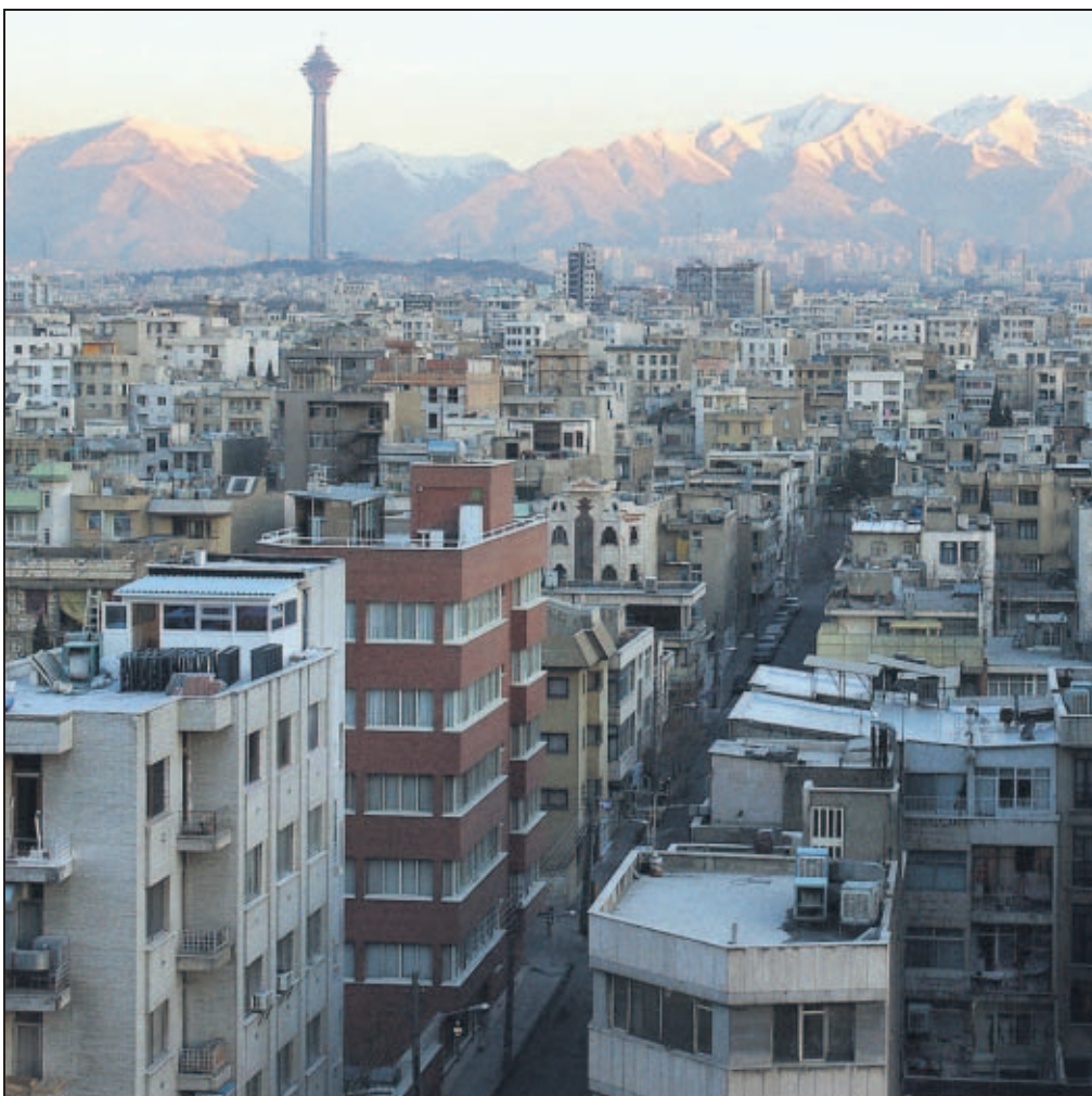
Teheran ist eine einzige Wüste aus Beton. In der 10 Millionenmetropole kommt man selbst auf den breit angelegten Straßen nur sehr langsam voran.