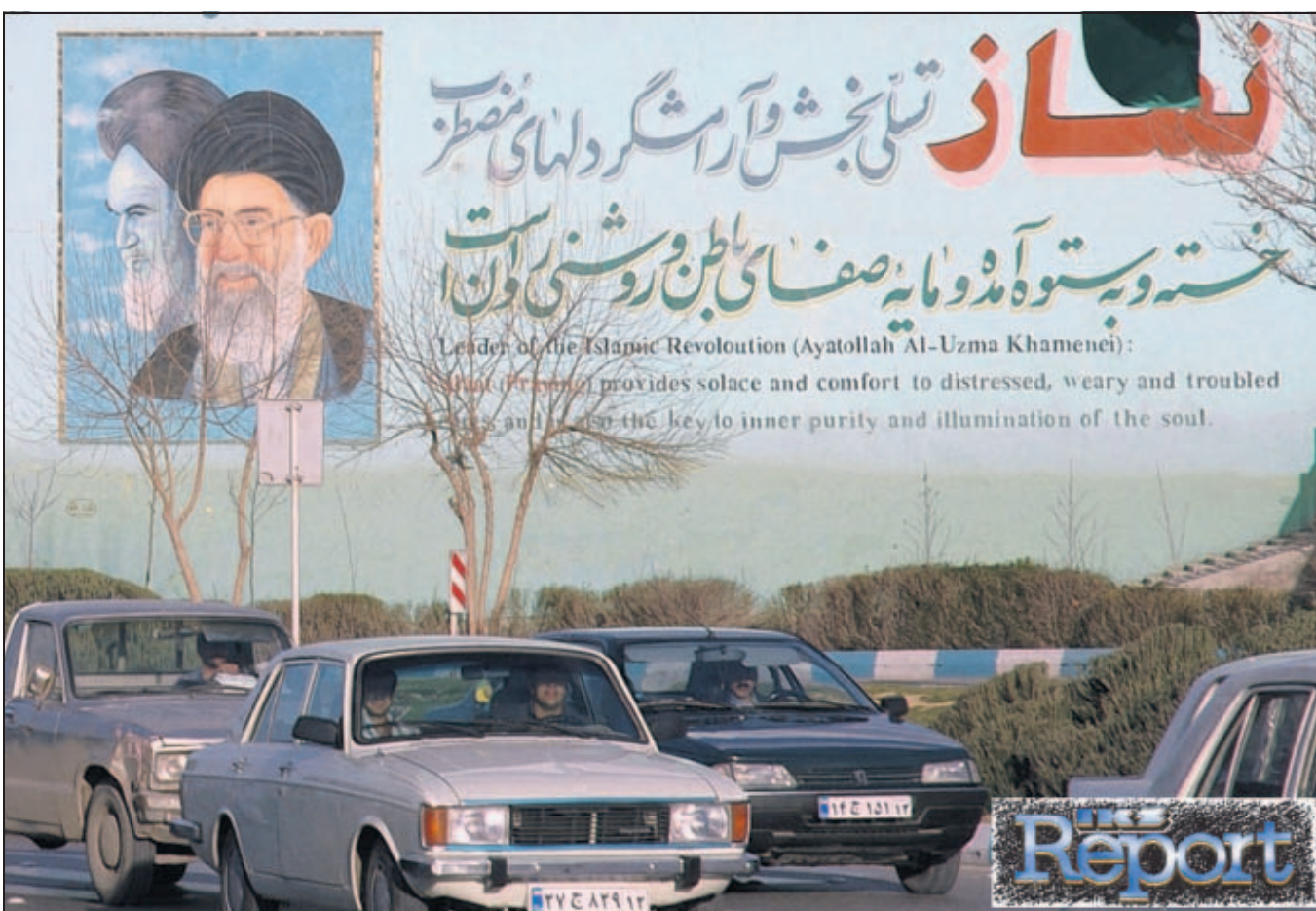
In Isfahan rollt der Straßenverkehr unter einem großen Plakat vorbei, das an den großen Revolutionsführer Ayatollah Khomeini erinnert. Wie im Märchen aus 1001 Nacht erhebt sich die Kulisse dieser Stadt mit ihren türkisblauen Kuppeln und Minaretten.

Noch lange frage ich mich, was so besonders ist an diesem Land, an das ich so oft zurückdenken muss und an den Menschen, denen ich begegnet bin. Vielleicht sind es die allgegenwärtigen, faszinierenden Kontraste, die ein mit offenem Herzen und offenem Geist Reisender wahrnimmt. Voller Dankbarkeit reflektiere ich diese Woche, die mein Leben bereichert hat, immer wieder. Ich bin sehr sicher, dass dieser Reise in den Iran noch weitere Besuche folgen werden.