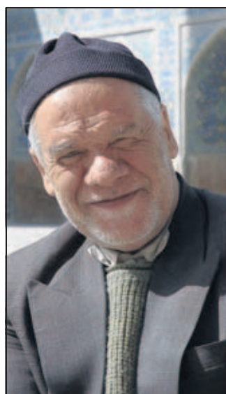
An einer Moschee in Isfahan saß dieser Iraner.